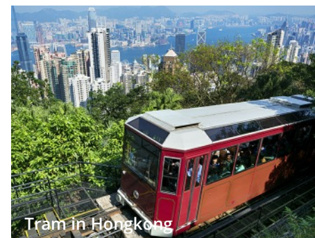
Tram in Hongkong