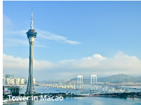
Tower in Macao