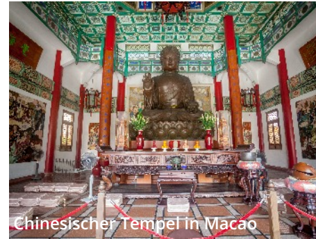
Chinesischer Tempel in Macao