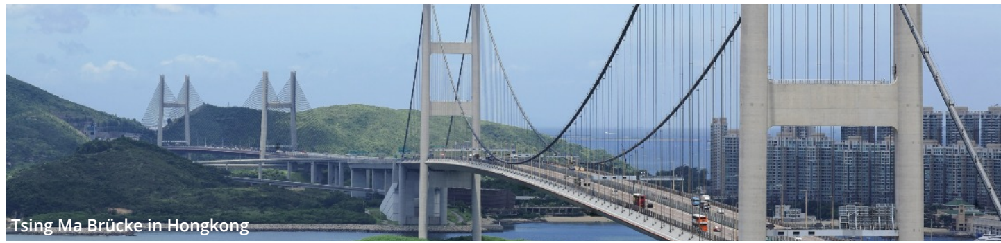
Tsing Ma Brücke in Hongkong