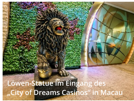
Löwen-Statue im Eingang des „City of Dreams Casinos“ in Macau