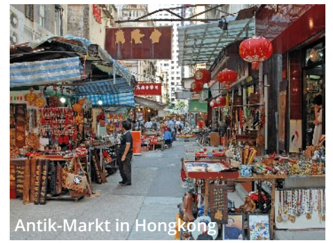
Antik-Markt in Hongkong